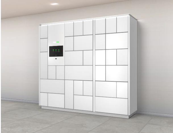
Impressie van de Bringme box